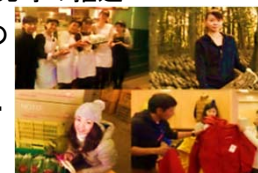
(農業女子プロジェクト)