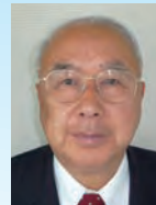
川添 健 鹿児島県長島町長