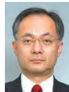
辻 琢也 一橋大学大学院 法学研究科 教授