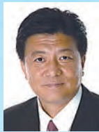
新藤 義孝 内閣府特命担当大臣 (地方分権改革)