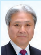
福田 富一 栃木県知事