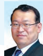
牧野 光朗 長野県飯田市長