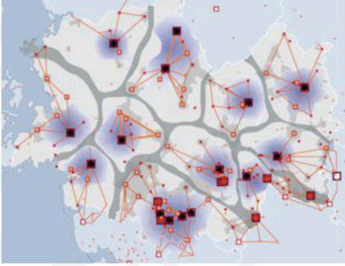
機能の『集約とネットワーク』