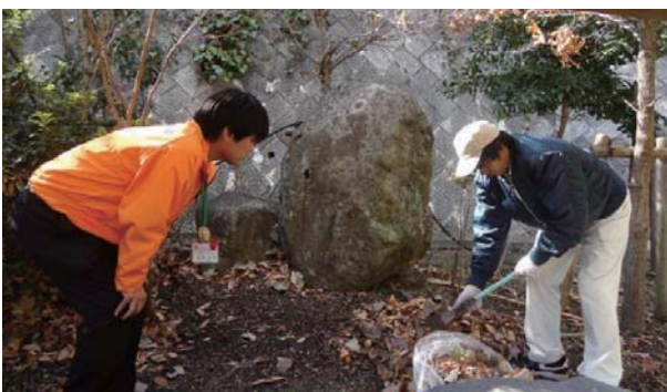
障がい者千人雇用センターの職員が定期的 に職場訪問し、定着支援を実施

さらに、平成24年4月には、障がい者と企業の橋渡し役として、市独自の「総社市障がい者千人雇用センター」を設置した。千人雇用センターでは、新たな就労者や就労先を増やしていくとともに、就労中の障がい者の就業面・生活面について、障がい者・企業の双方をサポートするなど、職場定着のためのきめ細やかな支援を行う体制を構築している。