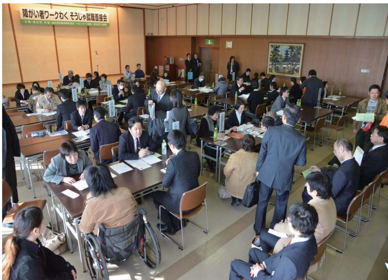
市が主催する障がい者就職面接会の様子。ハローワークや商工会議所と連携し、障がい者と企業の出会いの場を提供

総社市では、市を挙げて障がい者の雇用を促進するため、就労期（18～65歳）の障がい者が約1,200人いることを踏まえ、平成27年度末までに障がい者1,000人の雇用を達成することを目標として、平成23年12月、「総社市障がい者千人雇用推進条例」を制定した。