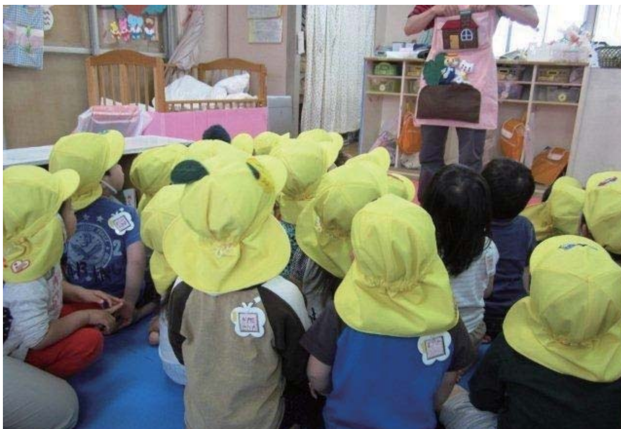
大阪市内の保育所の様子

大阪市では、保育の質を確保するため、乳児室を従来から国の基準を上回る面積で運用。一方で待機児童対策のため、緊急避難的な措置としての保育所面積基準も策定し、待機児童が多い地域においては、個々の保育所の状況を踏まえて、児童が安心・安全に過ごせる環境であることを確認した上で、ひとりでも多くの子どもが保育所に入所できるようにすることで、待機児童解消に資する取組を推進している。