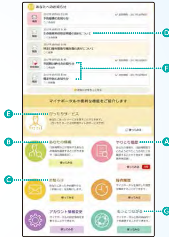
※上記の画面はイメージです。実際の画面とは異なる場合があります。