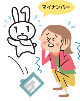
災害が起こったとき…