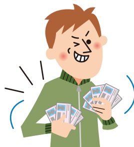
◎マイナンバーカードの偽造防止