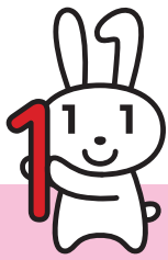
マイナンバー PR キャラクター マイナちゃん